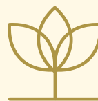
BEZ SUBSTANCJI LECZNICZYCH I STYMULUJĄCYCH