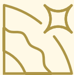
POPRAW WYGLĄD SKÓRY